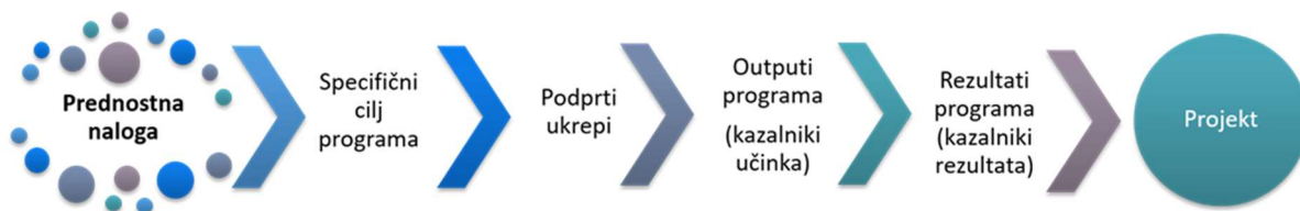
Slika 2: Intervencijska logika programa

Učinki so oprijemljivi dosežki projekta, ki prispevajo k rezultatom. Izhajajo neposredno iz dejavnosti, ki se izvajajo v okviru projekta. Ne vodijo do kvalitativne presoje rezultatov projekta. Z drugimi besedami, projekt ne bo nujno uspešen, ker bo organiziral veliko število delavnic (učinki). Učinki se običajno merijo v fizičnih enotah, kot so število seminarjev, obiskov na kraju samem, konferenc, udeležencev, publikacij, opredeljenih dobrih praks ali obravnavanih politik.