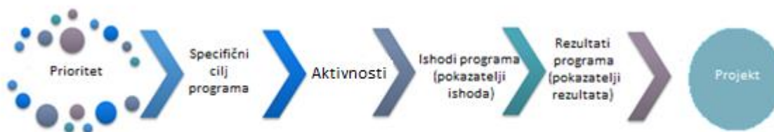
Slika 2 – Intervencijska logika programa

Ishodi su mjerljive isporučevine projekta koje doprinose rezultatima. Oni proizlaze iz aktivnosti koje se provode u projektu. Ne dovode do kvalitativne prosudbe o rezultatima projekta, drugim riječima projekt neće biti uspješan samo zato što organizira npr. velik broj radionica (ishoda). Ishodi se obično mjere u fizičkim jedinicama kao što su broj seminara, posjeta, konferencija, sudionika, objava, identificiranih dobrih praksi ili javnih politika kojima se bavi.