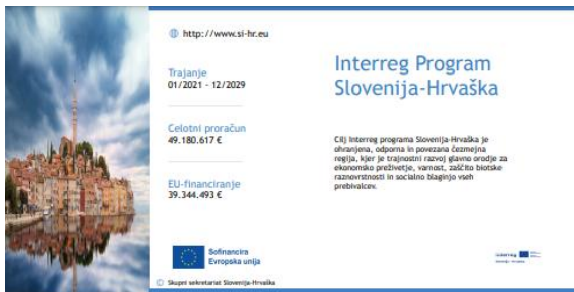
Slika 18: Predloga za pano

Tako kot pri predlogi panojev, predloga za tablo omogoča zagotavljanje ključnih informacij o projektu, da se zagotovi vidnost. Table je treba namestiti poleg kraja, kjer poteka projekt, saj morajo biti jasno vidne javnosti. Glavni elementi predloge table so: naziv dejavnosti, ime/akronim projekta, opis projekta, trajanje projekta (začetek in konec), skupna sredstva/prejeta podpora iz ESRR, logotip projekta, mesto za druge logotipe, sklic na spletno stran itd. Partnerji projekta lahko spremenijo predlogo, vendar mora vključevati elemente spodnje predloge.