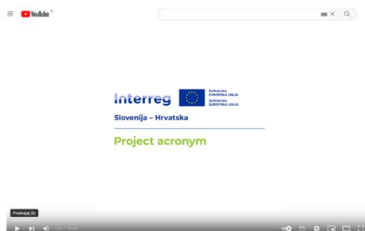
Slika 29: Primer – videoposnetki

Če projekti ustvarijo promocijske videoposnetke, mora biti logotip projekta viden na začetku ali koncu videoposnetka v prepoznavni velikosti in na ustreznem ozadju vsaj nekaj sekund.