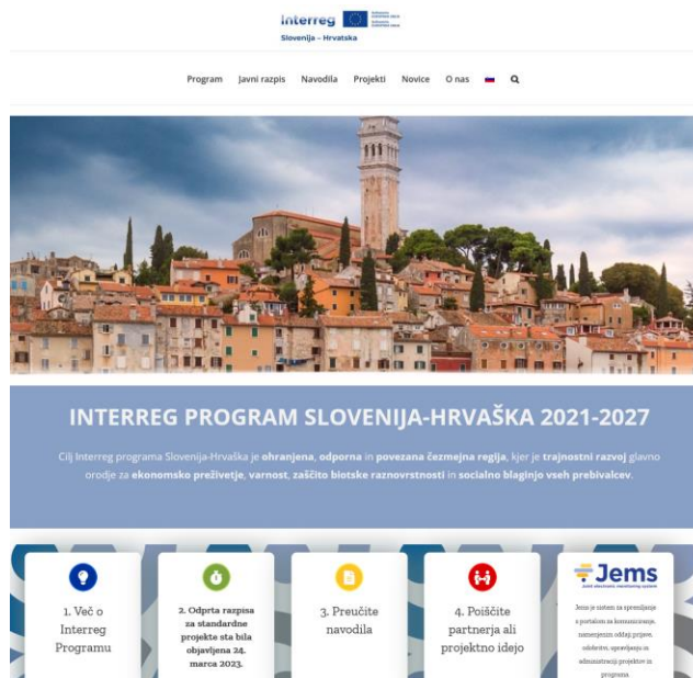
Slika 28: Primer – spletna stran

V primeru, da obstaja takšna spletna stran projekta, projektni partnerji zagotovijo informacije o projektu na svoji/h spletni/h strani/eh, vključijo kratek opis projekta, vključno z njegovimi cilji in rezultati, ter poudarijo skupno finančno podporo iz ESRR. Za takšne spletne strani projekta mora biti logotip projekta nameščen v zgornjem delu spletne strani in mora ustrezati jeziku, ki se uporablja na spletni strani.