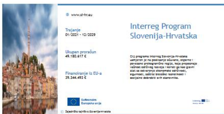
Slika 18. Predložak za pano

Kao i za predložke panoa, predložka za ploču omogućava pružanje ključnih informacija o projektu, kako bi se osigurala transparentnost. Ploče bi trebale biti postavljene uz mjesto gdje se projekt odvija, jer moraju biti jasno vidljive za javnost. Glavni elementi predložka ploče su: naziv aktivnosti, naziv/akronim projekta, opis projekta, trajanje projekta (početak i kraj), ukupna sredstva/dobivena podrška iz EFRR-a, logotip projekta, lokacije za druge logotipe, upućivanje na internetsku stranicu itd. Partneri projekta mogu promijeniti predložak, ali moraju uključivati elemente donjeg predložka.