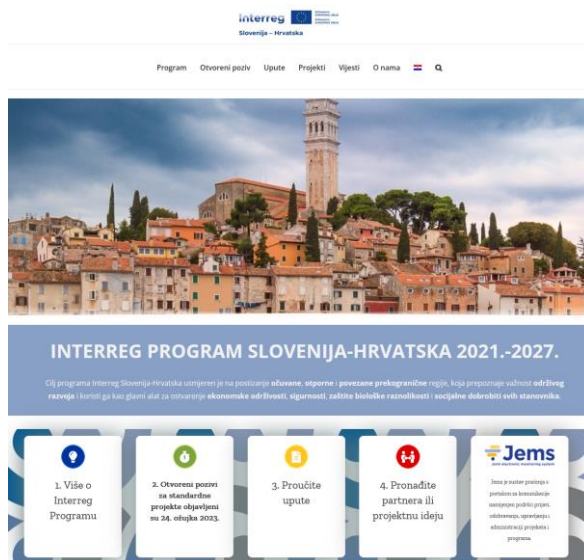
Slika 28. Primjer – internetska stranica

U slučaju da takva internetska stranica projekta postoji, projektni partneri moraju osigurati informacije o projektu na svojoj/im internetskoj/im stranici/ama, uključujući kratak opis projekta koji uključuje njegove ciljeve i rezultate, te istaknu ukupnu financijsku potporu iz EFRR-a. Za takve internetske stranice projekta logotip projekta mora biti pozicioniran u gornjem dijelu internetske stranice i mora odgovarati jeziku koji se koristi na internetskoj stranici.