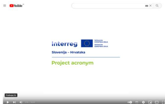
Slika 29. Primjer – videozapis

Ako projekti stvaraju promotivne videozapise, logotip projekta mora biti vidljiv na početku ili na kraju videozapisa u prepoznatljivoj veličini i u odgovarajućoj pozadini barem nekoliko sekundi.